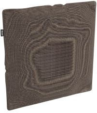
Cojín Decorativo Brisa Mocha 06818