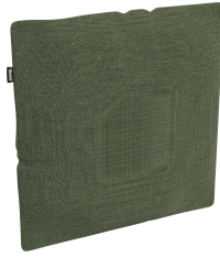
Cojín Decorativo Brisa Fern 06820