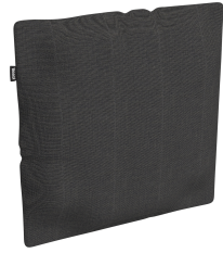
Cojín Decorativo Brisa Dolce 55 06821