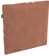
Cojín Decorativo Brisa Amber 06819