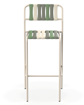
Taburete Gelato Nacar Lamas Pistacchio