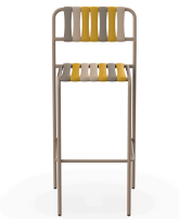
Taburete Gelato Duna Lamas Nocciola