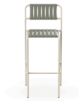
Taburete Gelato Nacar + Lamas Salvia