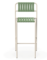
Taburete Gelato Nacar + Lamas Olivo