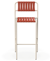
Taburete Gelato Nacar + Lamas Greda