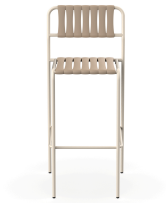
Taburete Gelato Nacar + Lamas Duna