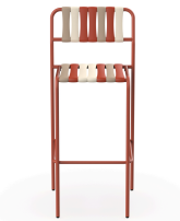
Taburete Gelato Greda Lamas Amarena