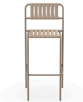
Taburete Gelato Duna Lamas Duna