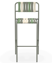
Taburete Gelato Salvia Lamas Pistacchio