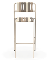
Taburete Gelato Nacar Lamas Toroncino