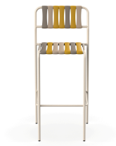
Taburete Gelato Nacar Lamas Nocciola