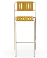
Taburete Gelato Nacar + Lamas Albero