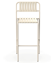
Taburete Gelato Nacar + Lamas Nacar