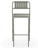
Taburete Gelato Salvia + Lamas Salvia