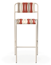
Taburete Gelato Nacar Lamas Amarena