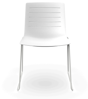
Silla Patin Skin Blanca 03458