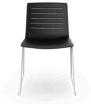
Silla Patin Skin Negra Estructura Blanca 03459