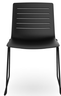
Silla Patin Skin Negra 06718