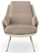
Butaca Anou Nacar Mud 07062