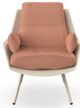
Butaca Anou Nacar Amber 07063