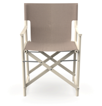
Silla Boss Nácar Tejido Mud 06827