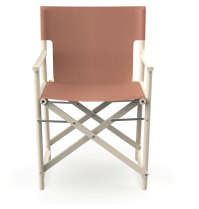
Silla Boss Nácar Tejido Amber 06826