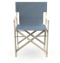
Silla Boss Nácar Tejido Denim 06828