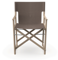
Silla Boss Duna Tejido Mocha 06825