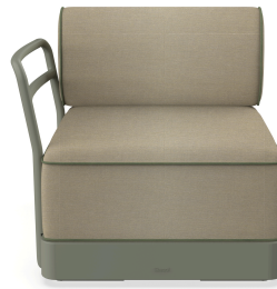
Brisa Terminal Salvia Cojin Limonetto + Fern 06882