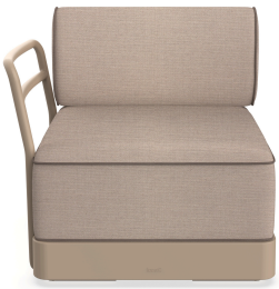
Brisa Terminal Duna Cojin Mud+Mocha 06880