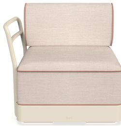
Brisa Terminal Nácar Cojin Hazelnut + Amber 06881