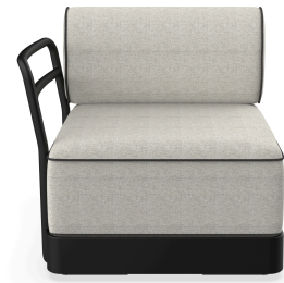
Brisa Terminal Noche Cojin Salina 05 + Dolce 55 06883