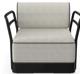
Sillon Brisa Noche Cojin Salina 05 + Dolce 55 06804