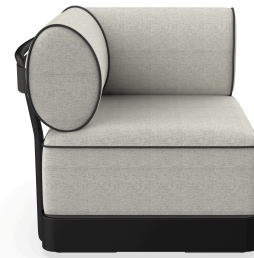
Brisa Corner Noche Cojin Salina 05 + Dolce 55 06800