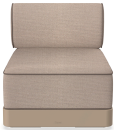
Brisa Basic Duna Cojin Mud + Mocha 06793