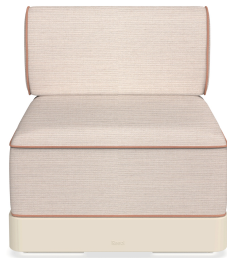
Brisa Basic Nácar Cojin Hazelnut + Amber 06794