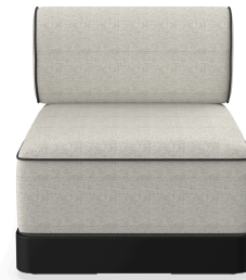
Brisa Basic Negro Cojin Salina 05 + Dolce 55 06796