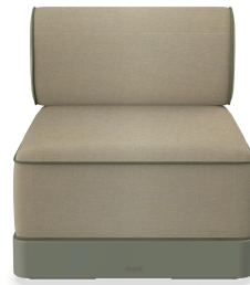
Brisa Basic Salvia Cojin Limonetto + Fern 06795