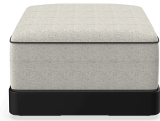
Brisa Ottoman Noche Cojin Salina 05 + Dolce 55 06792