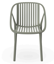
Silla Bini Gris Verdoso 05377