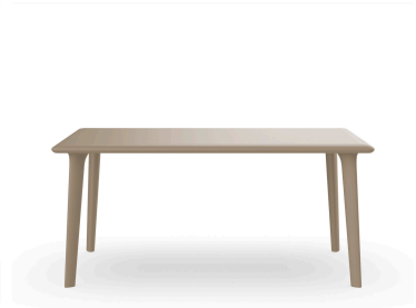
Mesa Dessa 160x90 Arena 03947