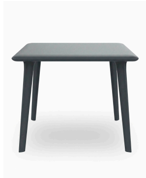
Mesa Dessa 90x90 Gris Oscuro 03944