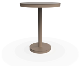
Mesa Barcino Ø60 Pie Central Arena 01431