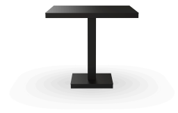
Mesa Barcino 80x80 Pie Central Negra 01413