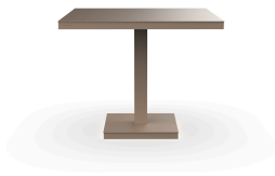
Mesa Barcino 90x90 Pie Central Arena 01421