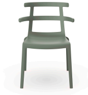
Silla Tokyo Gris Verdoso 01620