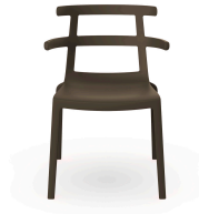
Silla Tokyo Chocolate 01621