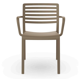
Silla Con Brazos Lama Arena 01326