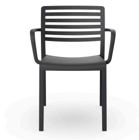
Silla Con Brazos Lama Gris Oscuro 01785