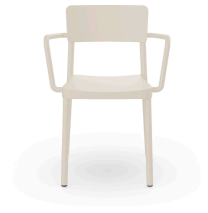
Silla Lisboa Con Brazos Marfil 07056