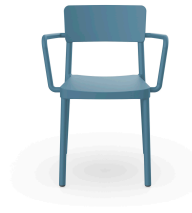
Silla Lisboa Con Brazos Azul Retro 05080