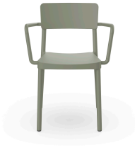
Silla Lisboa Con Brazos Gris Verdoso 07057