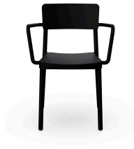
Silla Lisboa Con Brazos Negro 00820