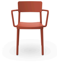
Silla Lisboa Con Brazos Greda 07058