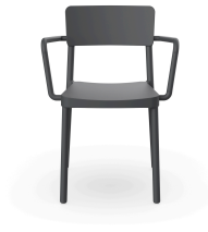
Silla Lisboa Con Brazos Gris Oscuro 00961